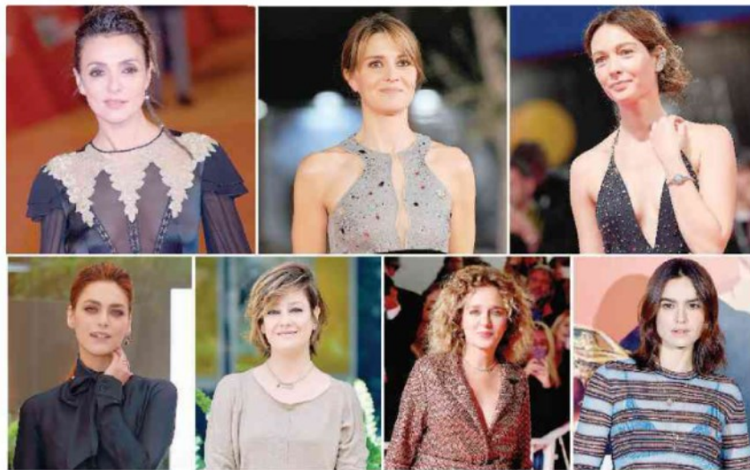
In alto da sinistra Ambra Angiolini, Paola Cortellesi e Cristiana Capotondi, sotto Miriam Leone, Giovanna Mezzogiorno, Valeria Golino e Kasia Smutniak