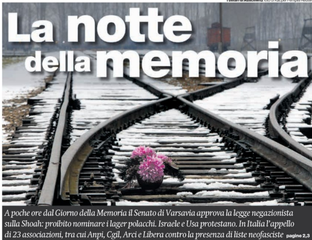
I binari di Auschwitz

Il giorno della memoria o, meglio la memoria della Shoah e del Portajmos, cioè dello sterminio di ebrei, rom e sinti da parte del nazismo, una memoria coltivata tutto l'anno, potrebbe e dovrebbe essere utilizzata come una lente attraverso cui esplorare il nostro presente. Quello che occorre tener presente è la dinamica del razzismo: il suo esito estremo, ma anche i suoi inizi, perché anche la Shoah non è cominciata con le camere a gas ma con il disprezzo - anche l'invidia - del diverso. — segue a pagina 15 —