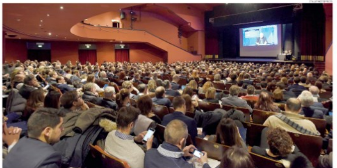
I lavori di Telefisco 2018 al teatro Carcano di Milano. La manifestazione è stata seguita in 156 sedi in tutta Italia

L'indice Pmi italiano al top da 7 anni mentre cala in mezza Europa