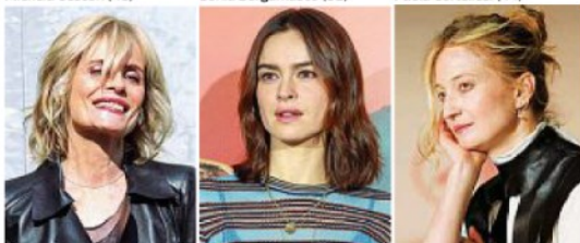
Isabella Ferrari (53) Kasia Smutniak (38) Alba Rohrwacher (38)