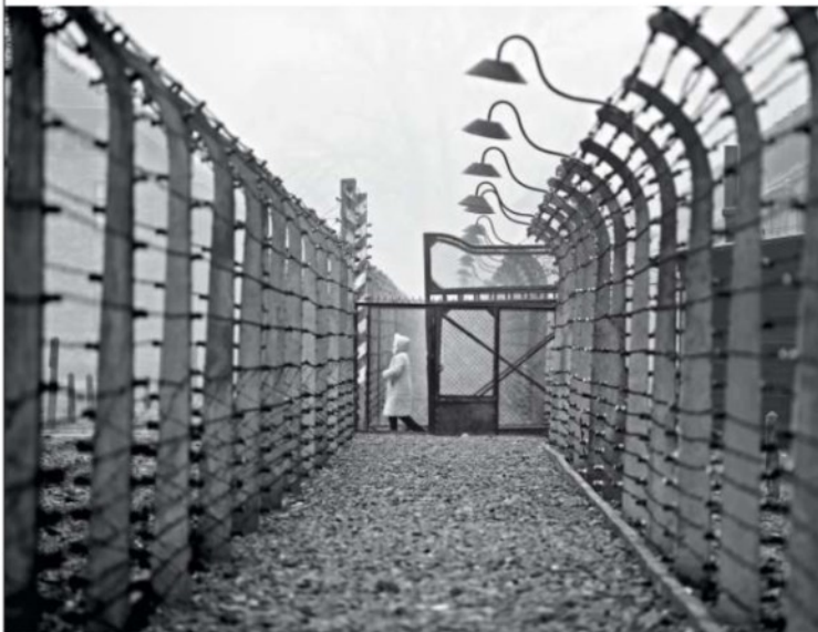
Il recinto di filo spinato intorno al campo di concentramento di Auschwitz