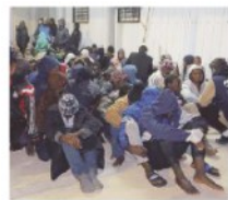
◦ GUIDO RAMPOLDI A PAG. 16

Ora l'emergenza dei profughi rientra nell'urna