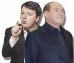
◦ MARRA A PAG. 2

■ Prima regola: non togliersi voti. Dal Piemonte alla Campania, dalla Toscana all'Emilia i due partiti scelgono la “desistenza” neanche fossero alleati. Solo Salvini cerca voti in zone che sono considerate “perdenti”