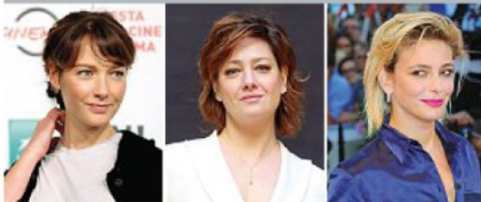
Cristiana Capotondi (37 anni) Giovanna Mezzogiorno (43) Jasmine Trinca (36)