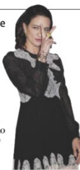
Asia Argento