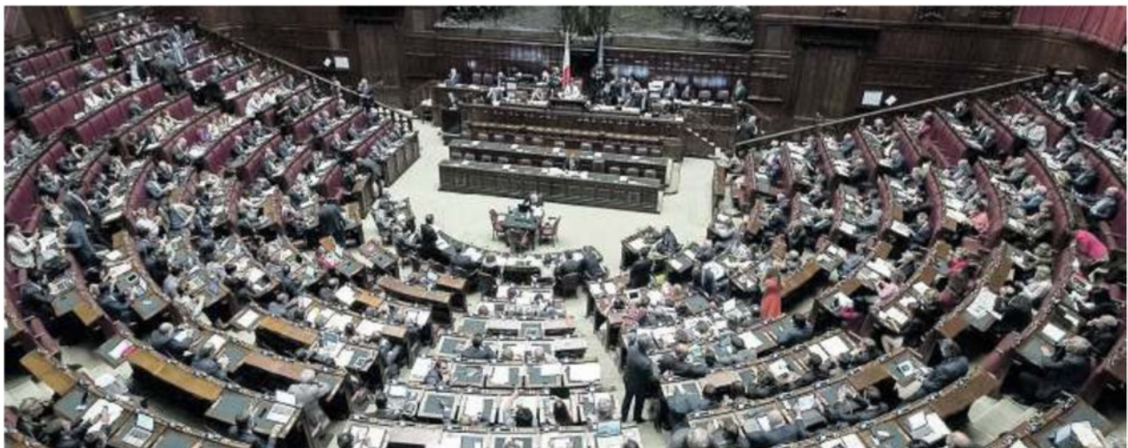
L'aula della Camera