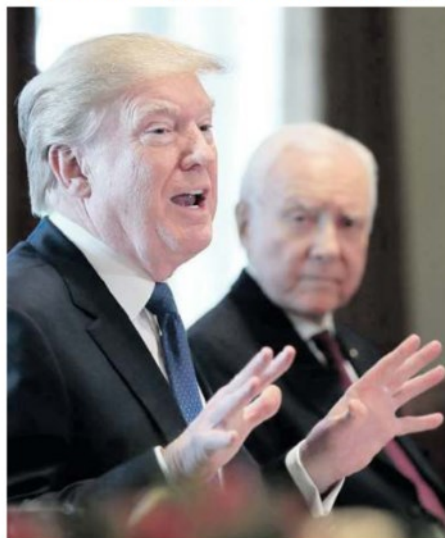
Battuta d'arresto per Donald Trump in Alabama

I repubblicani perdono lo storico seggio