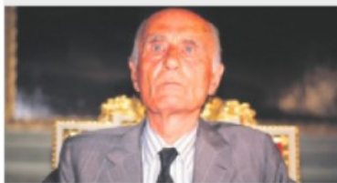
MAESTRO Indro Montanelli e il dibattito sull'eutanasia