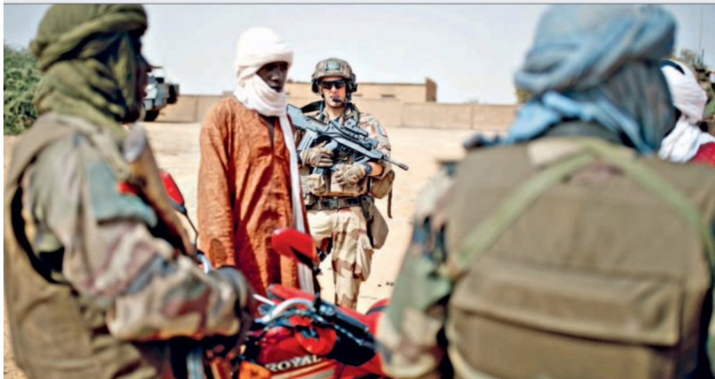
Soldati francesi impegnati nel Sahel: nei prossimi mesi saranno affiancati da una missione militare italiana con 470 uomini. Le nostre truppe si schiereranno in Niger e contribuiranno al controllo delle rotte usate dai trafficanti di uomini per arrivare al Mediterraneo

Missione militare italiana in Niger: controllerà la rotta dei migranti verso l'Europa