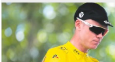
ACCUSE Chris Froome avrebbe abusato di un farmaco

Strutture di sicurezza e di intelligenza hanno monitorato la nascita e l'evoluzione del movimento No Tap (che si oppone al gasdotto in Salento) con l'escalation di violenze. Una galassia che gode dell'appoggio permanente del Movimento 5 Stelle, con in testa la senatrice Daniela Donno, ma anche di molti intellettuali vicini alla sinistra.