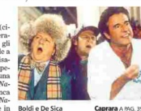
Boldi e De Sica Caprara A PAG. 39

Siamo all'ultima fetta di (cine)panettone? Una considerazione che non scoraggerà gli aficionados dall'andare nelle sale a farsi un po' di grasso e crasse risate, ma l'ultimo esemplare della specie segnala incontestabilmente una crisi creativa. Super Vacanze di Natale di Paolo Ruffini, che si affianca al cinepanettone classicissimo Natale da chef e alla sua variante in