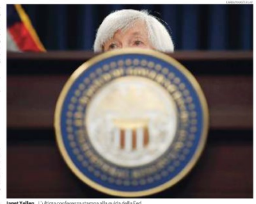
Janet Yellen. L'ultima conferenza stampa alla guida della Fed

Janet Yellen ha chiuso il suo mandato alla guida della Federal Reserve con un rialzo dei tassi interbancari di 25 punti base (tra il 1,25 e 1,50) e tenendo ferma la strategia di cauta normalizzazione della politica monetaria per accompagnare la ripresa dell'economia statunitense. Pur avendo rivisto