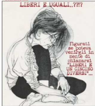
figurati se potevo venirti in mente di chiamarti "LIBERI E UN CINCINO DIVERSI"...

■ Alla proposta del senatore Augello (Idea) di sentire il banchiere, il Pd con Orfini risponde con una serie di altri testi, da Zonin a Consoli. Vuole anche la sorella di Ghedini per spaventare Fi. Se Casini non scioglierà la questione toccherà votare a maggioranza la scelta del calendario delle prossime (poche) audizioni