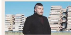
» MUSOLINO E TAGLIABUE A PAG. 10

"Gomorra & C. sono serie diseducative". "No, il Male va narrato senza censure"