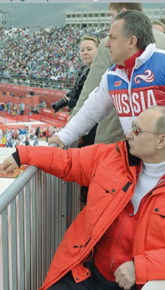
Il presidente russo Vladimir Putin (65 anni) con l'ex ministro dello Sport Vitaly Mutko (58 anni) a Sochi 2014