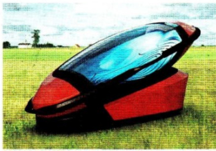
CASSA DA MORTE Sarco, macchina per suicidarsi stampabile in 3D

Il Senato accelera: legge sul fine vita da approvare in pochi giorni. E arriva la macchina per uccidersi a casa