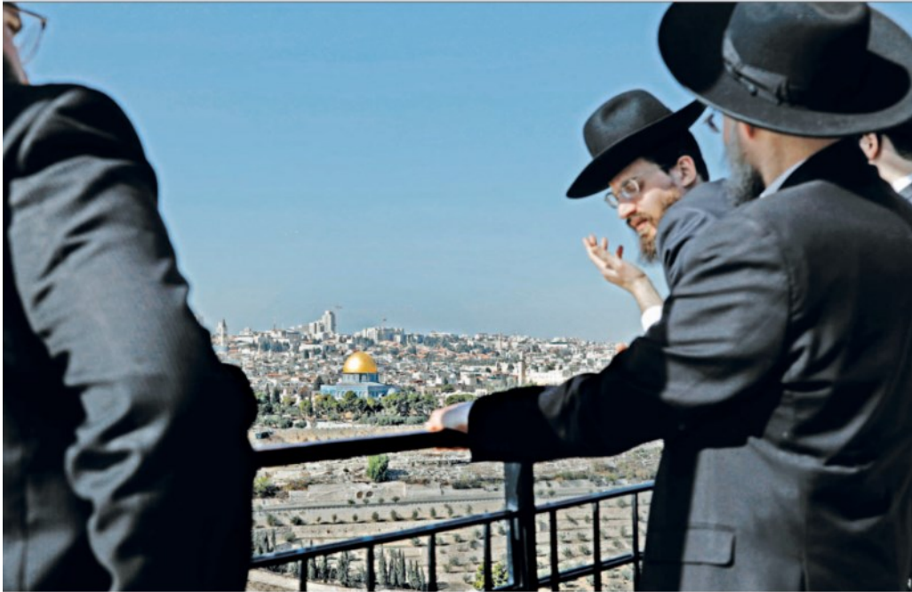
Gerusalemme sempre più divisa: ebrei ultraortodossi osservano la città dal Monte degli Ulivi