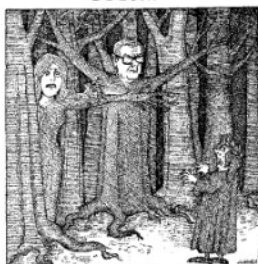
nel mezzo del cammin di nostra vita mi ritrovai per una selva oscura.