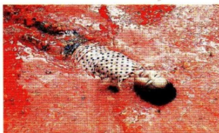
ORO ROSSO Bimba sudcoreana al festival del pomodoro di Sanae-myeon