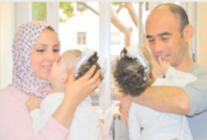
MIRACOLO Le sorelline separate dopo dieci ore di operazione