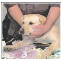
Bacio davanti ai soldi scovati