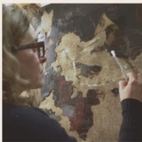
I giocatori di carte Il restauro di Daniela Lippi

"Così stiamo facendo rinascere il quadro rovinato dalla bomba"