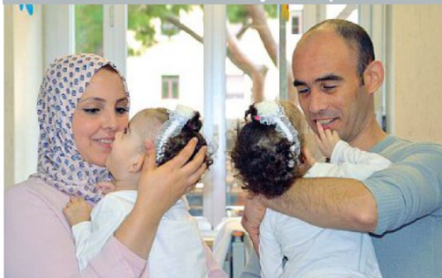
Le gemelline algerine di 17 mesi in braccio alla mamma e al papà dopo il delicato intervento al Bambino Gesù di Roma