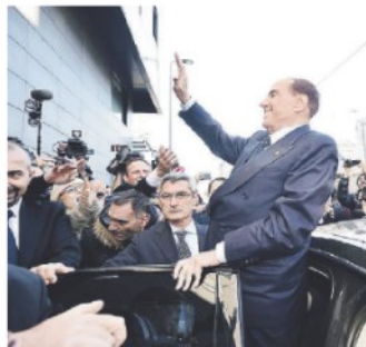
DAL PREDELLINO L'arrivo di Berlusconi a Milano