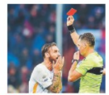
DE ROSSI Espulso per uno schiaffo

«A Ostia è lotta fra clan. Le pistole hanno sparato per la seconda volta in tre giorni, stavolta contro la porta di casa di un esponente del clan Spada. «Lì ci giochiamo un pezzo della sovranità del nostro Paese», dice il ministro dell'Interno, Marco Minniti. «Quello che sta avvenendo non è tollerabile in una democrazia». Parole decise come gli interventi promessi: «Saremo duri e intransigenti».