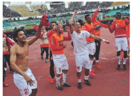
SAN NICOLA L'omaggio finale dei biancorossi ai tifosi

Un foggiano punisce un Foggia blindato Bari in vetta da solo