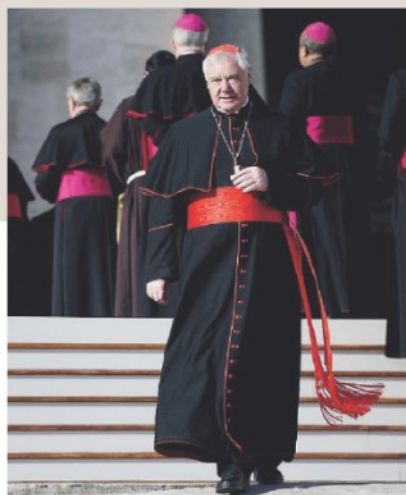
VATICANO Il cardinale Gerhard Ludwig Müller

«C'è un "fronte" contro il Papa, composto dalle frange più tradizionaliste e più progressiste della Chiesa che potrebbe portare a uno scisma. Ne parla l'ex prefetto della Congregazione della Dottrina della Fede, il card. Gerhard Müller, che adombra l'ombra di un complotto: «Mi vorrebbero a capo, non lo farò mai!».