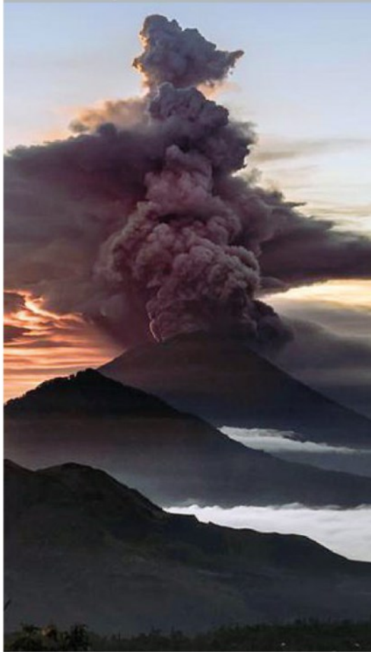
Cenere e fumo fuoriescono dal vulcano Agung sull'isola indonesiana di Bali