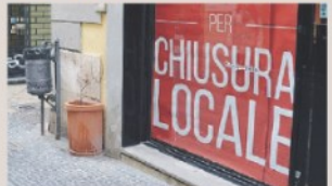
NATILE IN CRONACA >>> BARI Negozi in crisi per mala, abusivi e falsi

Il 58% dei negozianti «colpito» dalla mala Bari, chiedono pene più severe e immediate