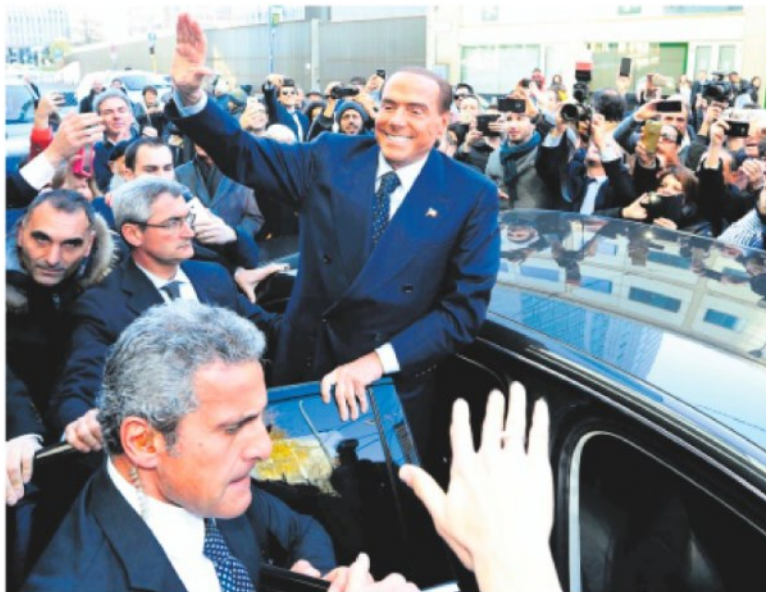
PREDELLINO 2.0 Il leader di Forza Italia Silvio Berlusconi all'uscita dalla kermesse azzurra di Milano

Il Cavaliere: «Centrodestra unito contro il pericolo grillino» E poi: «Io premier o uno come il generale Gallitelli»