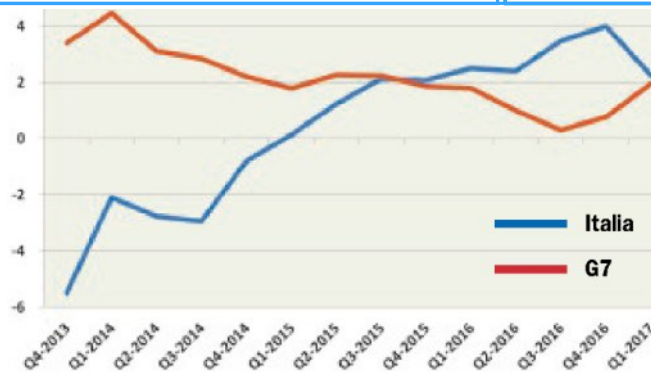
Investimenti fissi lordi. Dati destagionalizzati, var. % tendenziali rispetto lo stesso bimestre dell'anno precedente