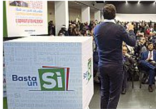
Il referendum Da presidente del Consiglio Renzi punta sul Sì alla riforma costituzionale. Al referendum del 4 dicembre 2016 prevalgono i No e lui si dimette