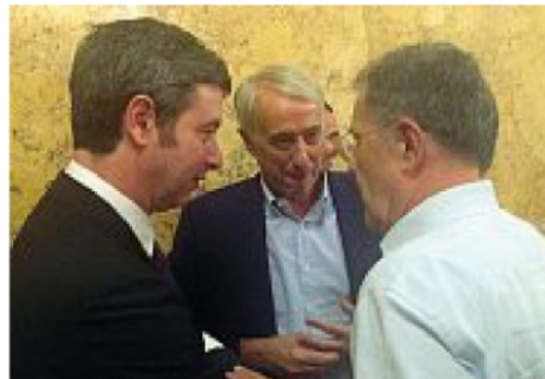
I delusi Da sinistra, il ministro Andrea Orlando con Giuliano Pisapia e Romano Prodi. Ieri i tre si sono incontrati a margine di un evento a Bologna