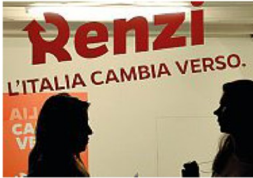
Le primarie Dopo essere stato sconfitto nel 2012, Matteo Renzi nel dicembre 2013 vince la corsa alla segreteria del Pd. Due mesi dopo diventa premier