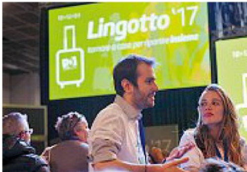
Nuovo inizio Dopo aver lasciato anche la carica da segretario pd, nel marzo 2017 Renzi rilancia la sua candidatura con una convention al Lingotto di Torino