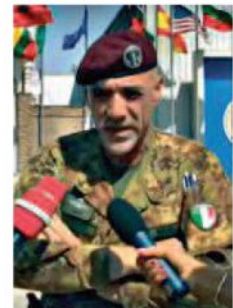
IL GENERALE Carmine Masiello, consigliere militare del premier, è al vertice del Nsc che coordina la sicurezza cibernetica e a cui fanno riferimento tutte le strutture